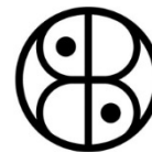
Baltic Sea Indigenous Court

Pašu pašvaldību un valsts Latvijas Republika veidotājiem (valsts ir Latvijas resursu tiesiska sadalītāja pilsoņiem un pavalstniekiem) par likumiem Latvijā (likums ir vienošanās kas pamatiedzīvotāja paša apstiprināta)