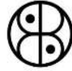
Baltic Sea Indigenous Court