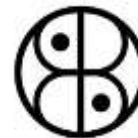
Baltic Sea Indigenous Court